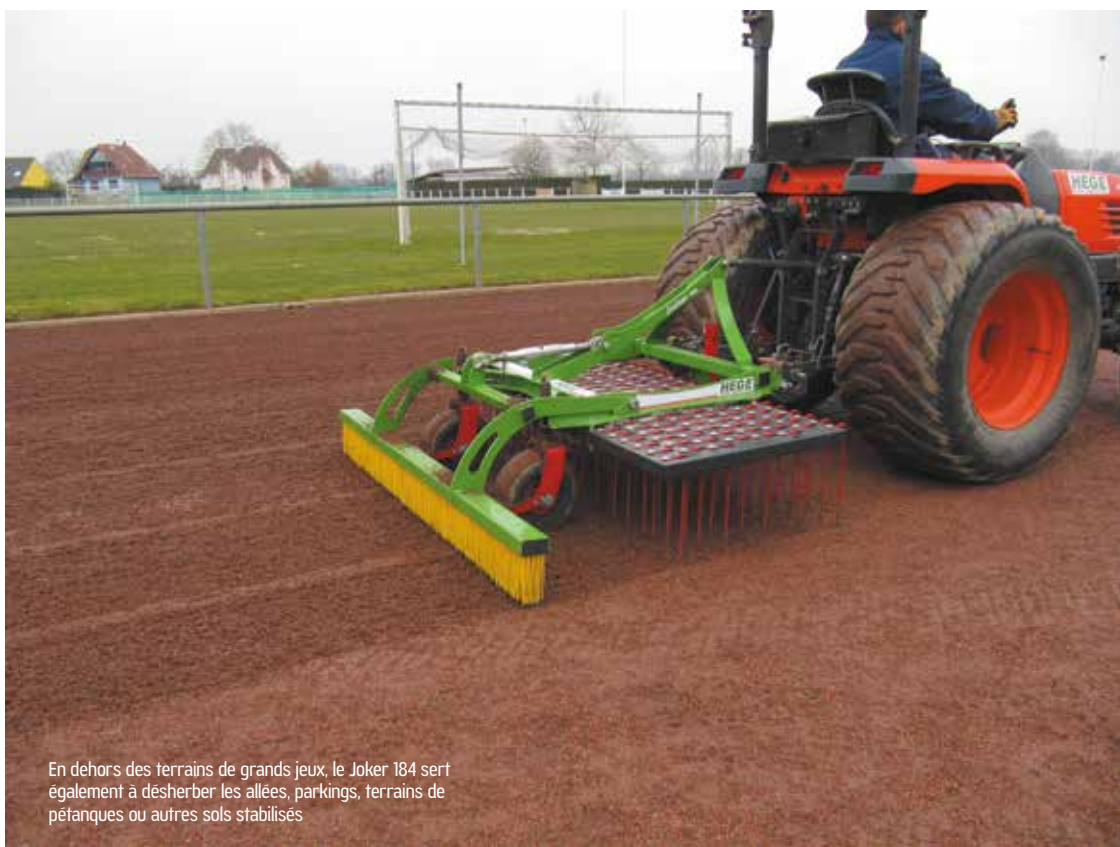
En dehors des terrains de grands jeux, le Joker 184 sert également à désherber les allées, parkings, terrains de pétanques ou autres sols stabilisés