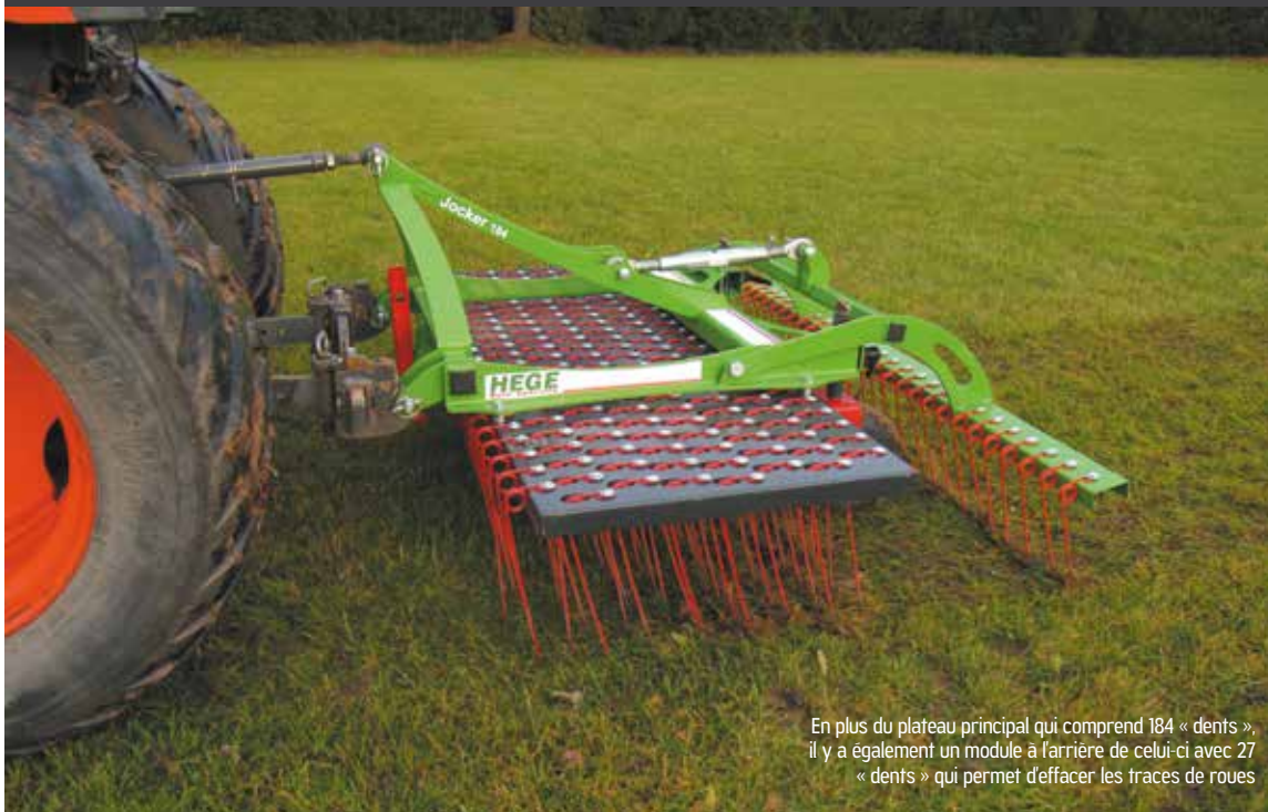
En plus du plateau principal qui comprend 184 « dents », il y a également un module à l'arrière de celui-ci avec 27 « dents » qui permet d'effacer les traces de roues

Durant de nombreuses années, l'entreprise Hege Sols Sportifs utilisait le peigne à gazon, appelé Joker 184, pour les prestations qu'elle effectuait sur les terrains naturels. Depuis deux ans, elle le commercialise pour la plus grande satisfaction des collectivités qui s'appuient sur sa polyvalence et son efficacité, notamment contre les vers de terre.